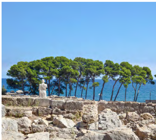
Ruines d'Empúries L'Escala

Situado en un entorno incomparable frente al mar, en el precioso camino de ronda que va de la Escala a Sant Martí d'Empúries, podéis visitar las ruinas de la antigua ciudad griega y romana de Empúries. Creada a inicios del s.I antes de Cristo, fue la puerta principal de estas dos culturas en nuestra península.